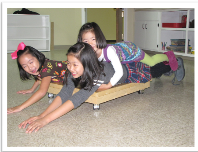
感恩节孩子们的欢乐游戏