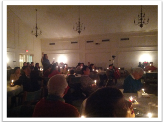
圣诞节晚餐会后在烛光下唱赞美诗